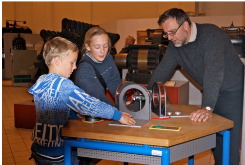
Technisches Museum Wien.

Obwohl wir schon im November 2010 ein langes Wochenende in Wien waren, möchte ich dies jetzt zum Anlass nehmen, um auf das Technische Museum hinzuweisen: Durch einen tollen Zubau im Eingangsbereich begibt man sich in die Räumlichkeiten und das Begeisternde daran: technische Themen werden mit einer hohen Sinnesqualität speziell für Kinder veranschaulicht. (Aber nicht nur für Kinder!) Beim nächsten Wienbesuch steht das Technische Museum wieder ganz oben auf der Liste. www.tmw.at